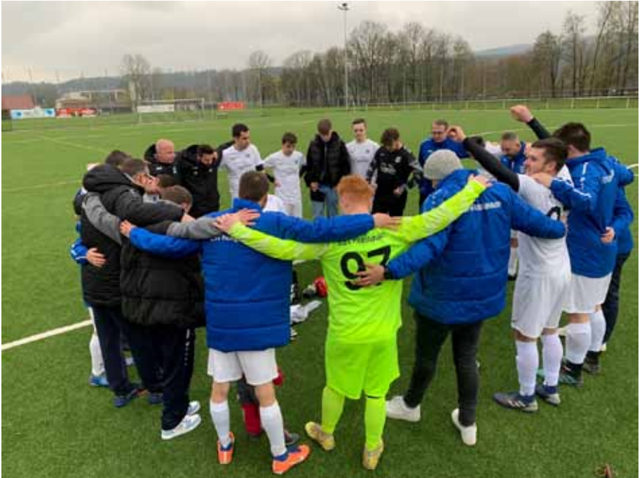
Der Siegerkreis nach dem verdienten 2:5 Sieg am vergangenen Wochenende in Bebra.