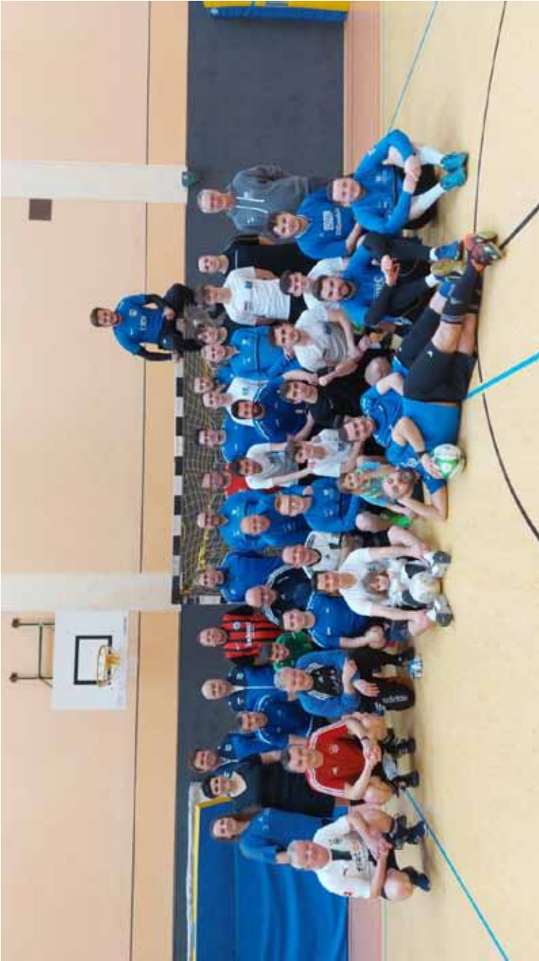
Gruppenbild aller Teilnehmer am Spaßturnier des ESV Ronshausen in der Rotenburger Großsporthalle am 29.01.2023. Neben Getränken und selbstgebackenen Leckereien gab es mittags für alle reichlich Familienpizzen.