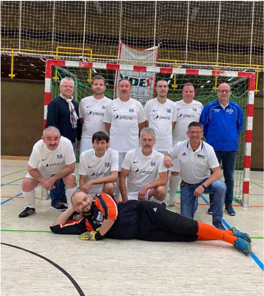
Die Bilder zeigen das ESV-AH-Team bei der Hallenkreismeisterschaft in Obersuhl, beim diesjährigen Faschingsturnier und bei der VDES-Regionalmeisterschaft in Bensheim.