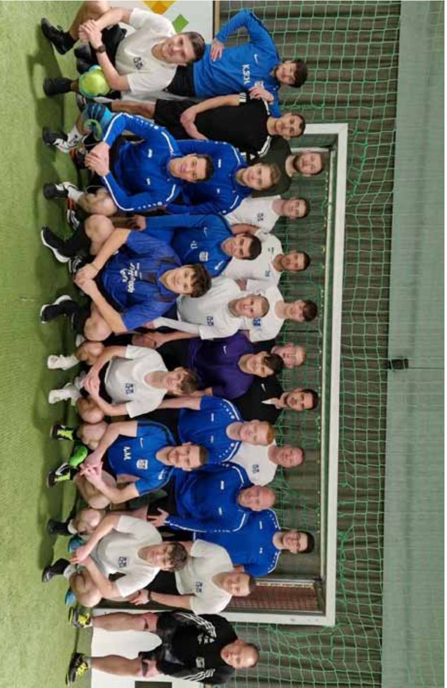
Viel Spaß hatte das Team in der Soccerhalle in Kassel am 27.12.2022.