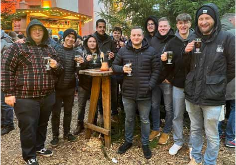
Besuch der Mannschaft auf dem Weihnachtsmarkt in Fulda.