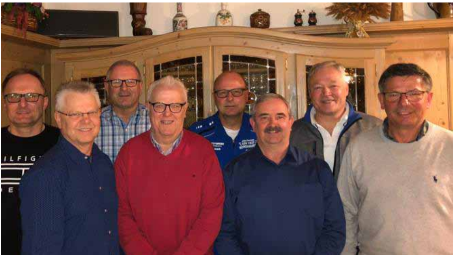
AH-Abteilungsvorstand nach der Wiederwahl im Vereinslokal.