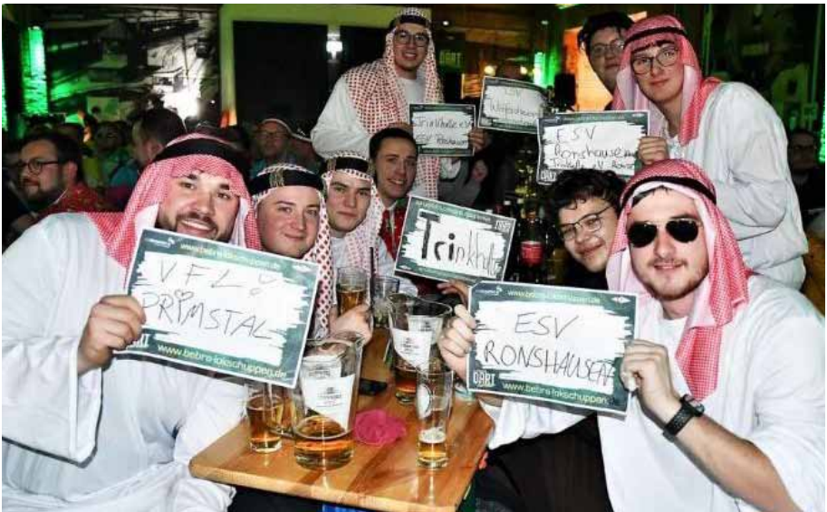
Das Team vom ESV war überall vertreten sowie hier im Januar im Lokschuppen beim großen Dart-Event.