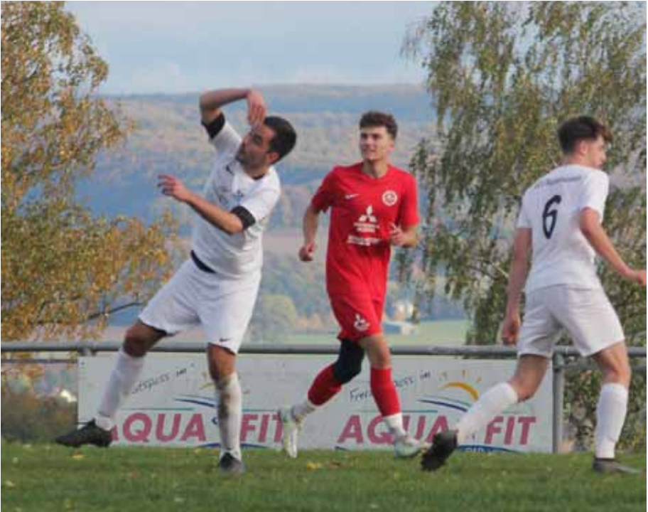
Was der Weppo da macht, ist nicht ganz ersichtlich. Es war wohl ein gelungener Kopfball.