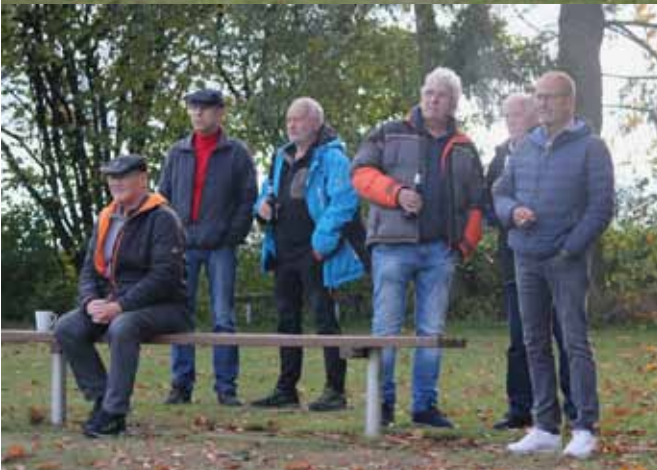
Einige unserer treuen Fans beim letzten Auswärtsspiel in Wippershain.