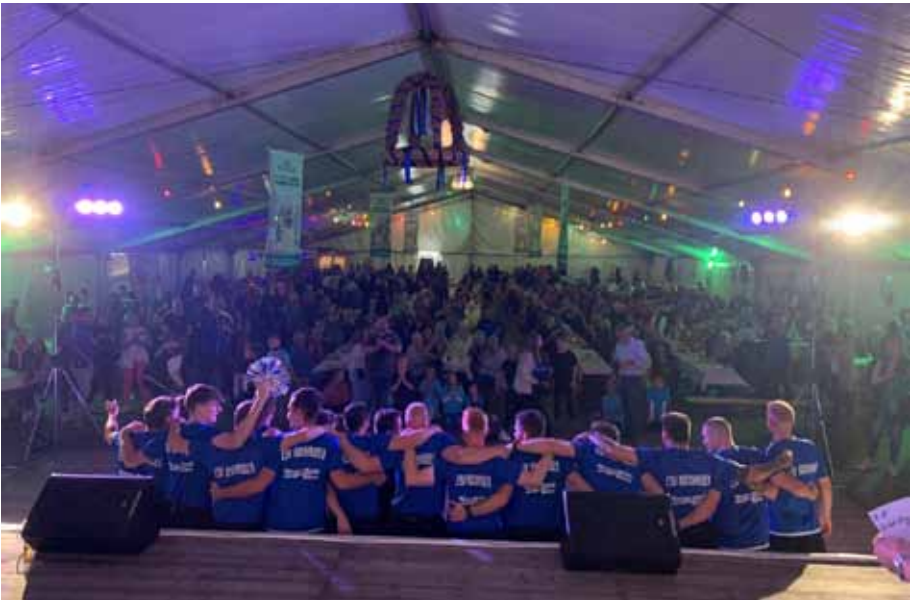
Das Publikum forderte mit stehenden Ovationen Zugaben.