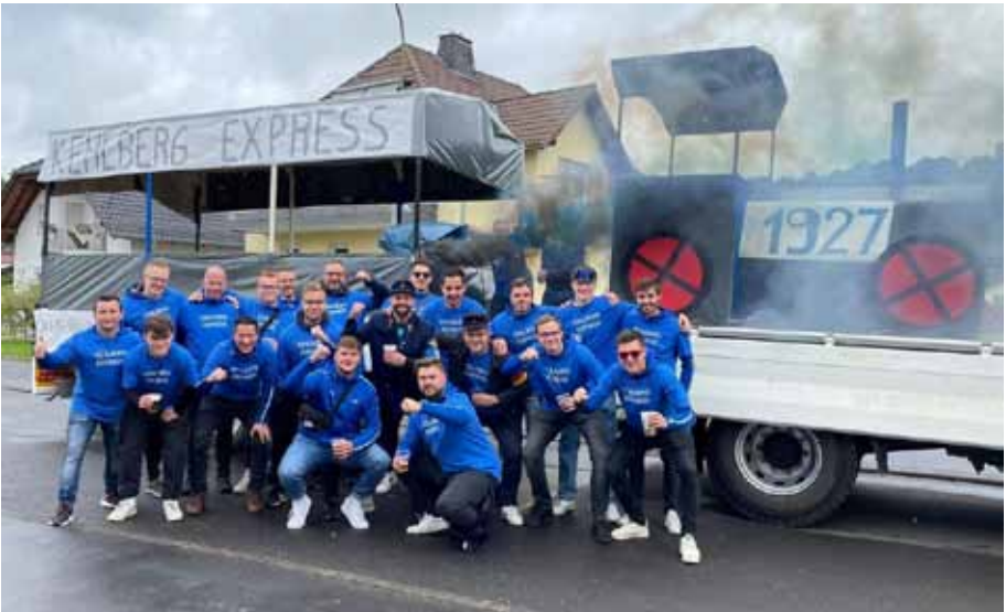
Nach der Fertigstellung: Der Kehlberg Express, der im Laufe der Kirmes richtig in Fahrt kam und die Massen begeisterte.