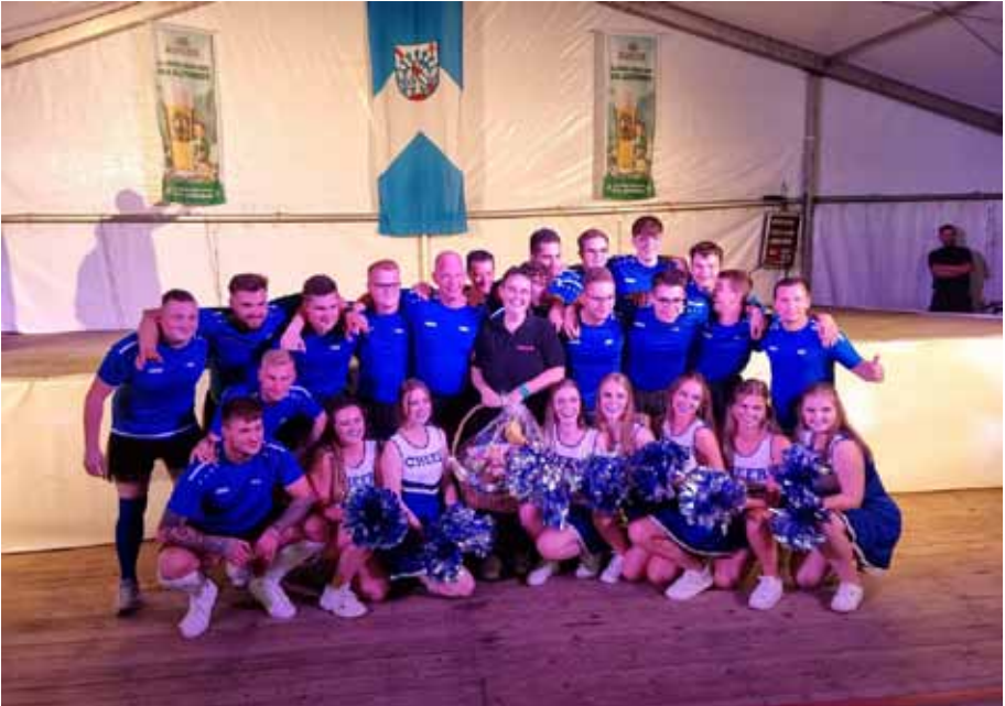
Eine Traumgemeinschaft: Das Männerballett und die Ulfepelern.