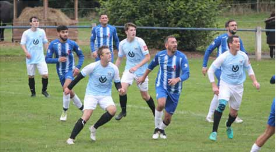
Acht Blicke gen Himmel, wo irgendwo der Ball zu sein scheint. Szene aus ESV Ronshausen gegen Espanol Bebra.