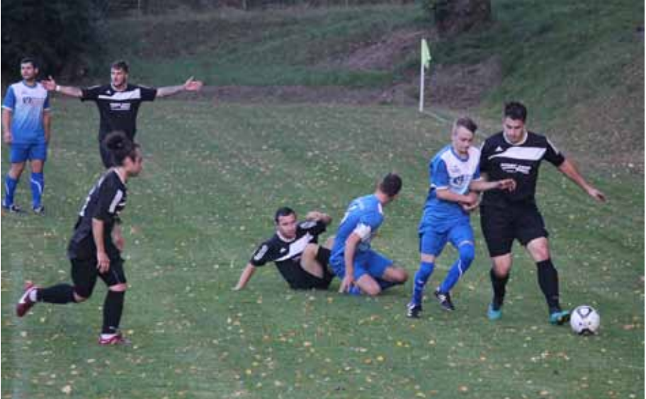
Vor allem in der zweiten Halbzeit kam man mehr ins Straucheln und bekam noch drei Gegentore trotz eigener guter Chancen.