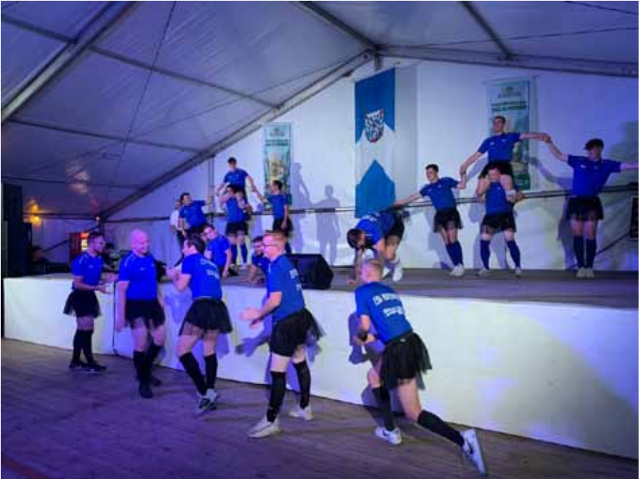
Kam bestens an auf dem Heimatabend: Das Männerballett des ESV Ronshausen.